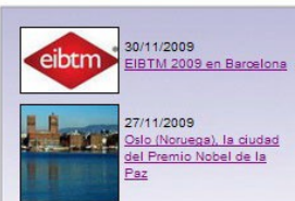
30/11/2009 EIBTM 2009 en Barcelona